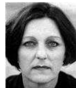
Herta Müller, 2009