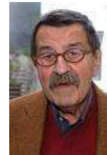
Günter Grass, 1999