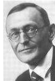
Hermann Hesse, 1946