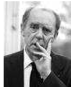
Heinrich Böll, 1972