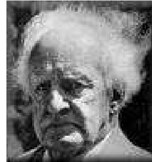
Gerhart Hauptmann, 1912