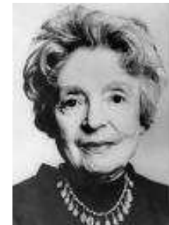
Nelly Sachs, 1966